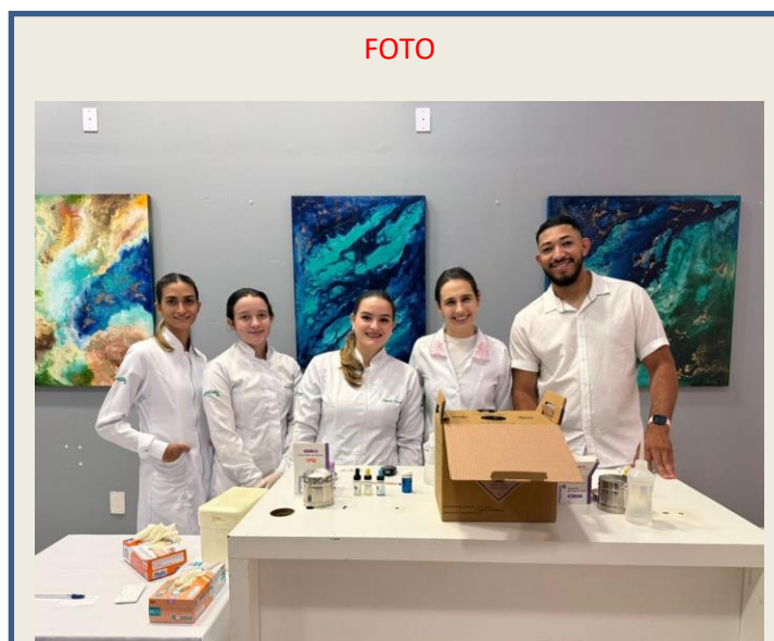
FIGURA 1. AÇÃO DO SHOPPING 2025