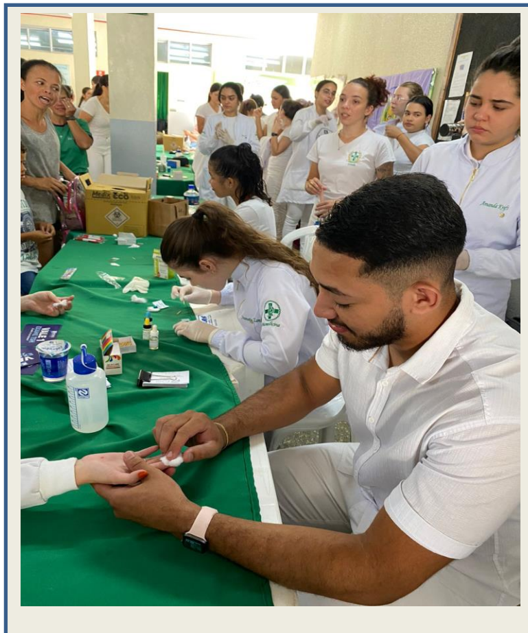
FIGURA 1. ESTAVA NA FACULDADE REALIZANDO UMA TIPAGEM SANGUINEA 2025