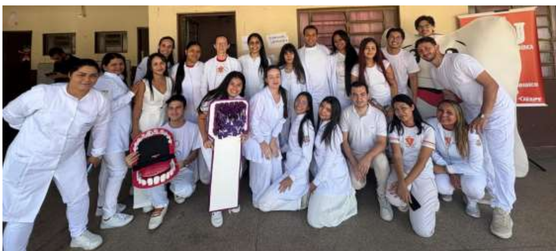
Figura 1 – Turma de Odontologia no Projeto Social Sopão Comunitário na Igreja Católica São José, Cuiabá/MT