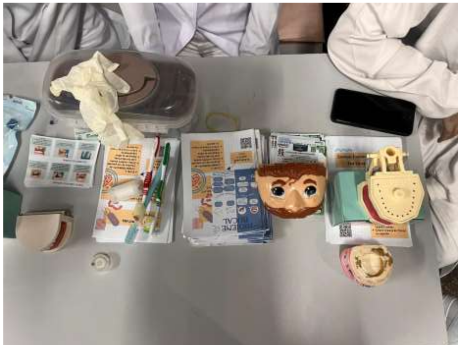
Figura 7 - Materiais Odontológicos, Panfletos sobre higiene oral - Ação na Escola Estadual André Avelino Ribeiro, Cuiabá/MT