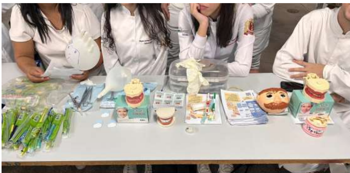
Figura 8 – Materiais Odontológicos, Panfletos sobre higiene oral - Ação na Escola Estadual André Avelino Ribeiro, Cuiabá/MT