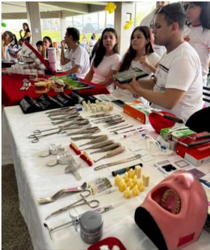
Figura 14 – Materiais Odontológicos para a apresentação - Feira das Profissões – Faculdade Fasipe – Cuiabá/MT