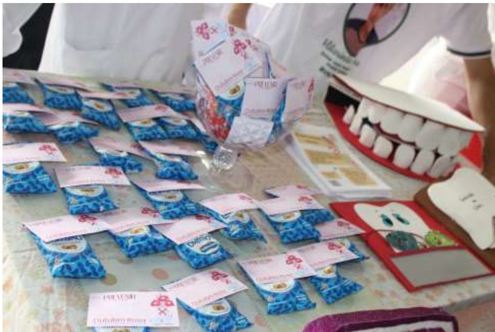
Figura 12 – Panfletos orientativos sobre a higiene oral - Feira das Profissões – Faculdade Fasipe – Cuiabá/MT