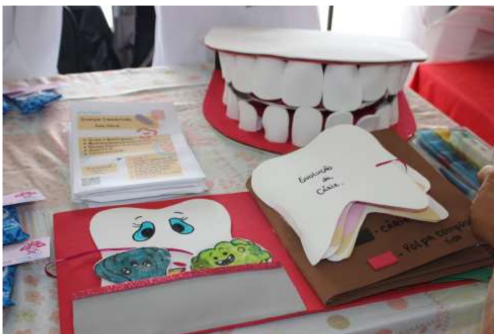
Figura 13 – Materiais Lúdicos para a apresentação - Feira das Profissões – Faculdade Fasipe – Cuiabá/MT