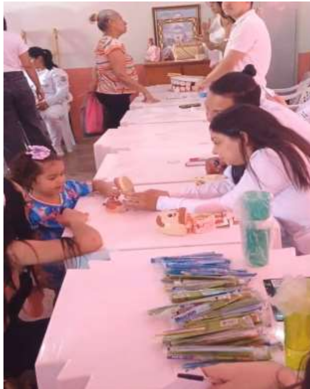
Figura 2 – Alunos apresentando de forma lúdica sobre a orientação de higiene oral