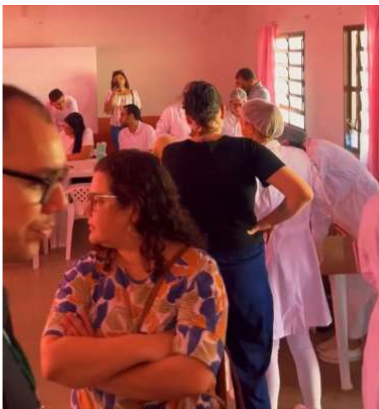
Figura 5 - Projeto Social Sopão Comunitário na Igreja Católica São José, Cuiabá/MT