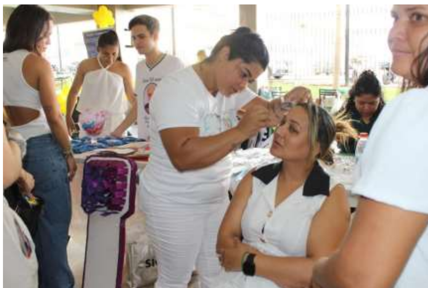
Figura 15 – Feira das Profissões – Faculdade Fasipe – Cuiabá/MT