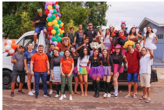
Figura 2. Foto de todos os comunitários do projeto. Local: Rua dia 12/12/2025.