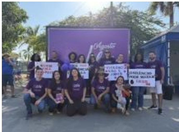
Figura 4. Equipe do CRAS.