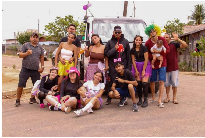
Figura 4. Foto de alguns dos comunitários do projeto. Local: Rua dia 12/12/2025.