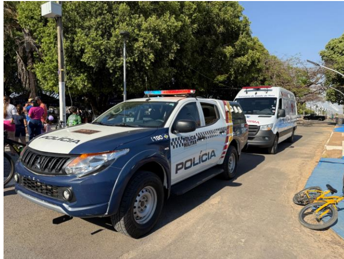
Figura 3. Foto dos veículos de apoio.