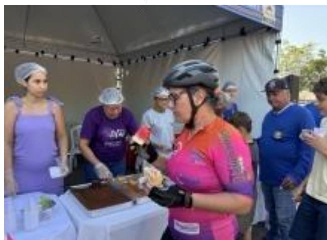
Figura 4. Equipe fazendo a realização do café.