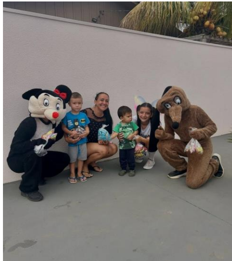
Figura 1. Realização da entrega dos doces. Local: Rua dia 12/12/2025.