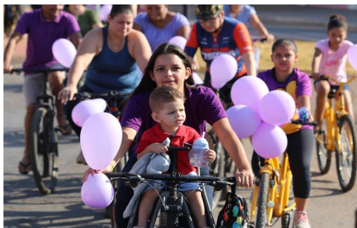
Figura 2. Aluna fazendo a participação do pedal. Local: Trajeto dia 30/08/2025.