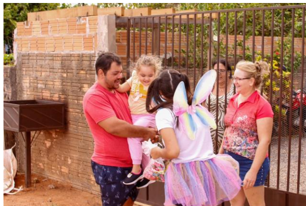
Figura 3. Aluna fazendo a realização da entrega dos doces. Local: Rua dia 12/12/2025.