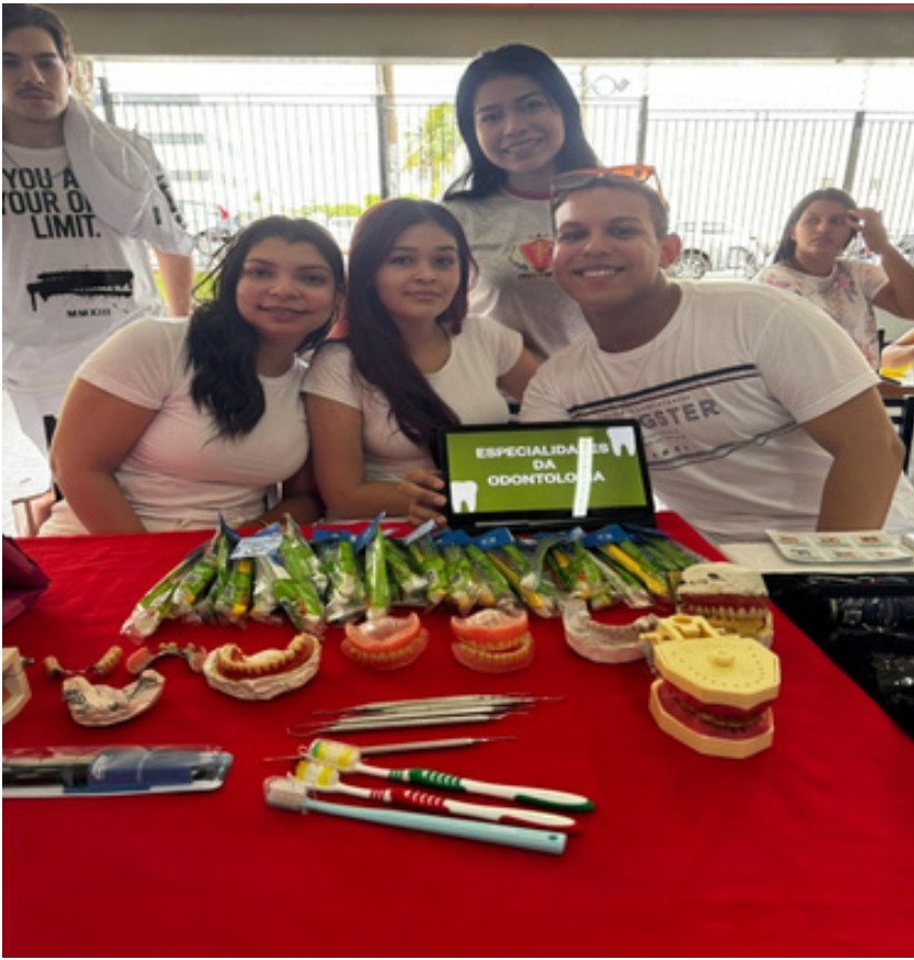
Figura 5. Grupo com a apresentação.