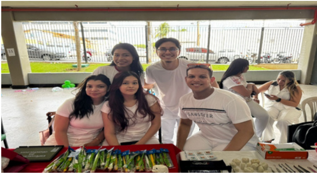
Figura 1. Foto do grupo reunido.