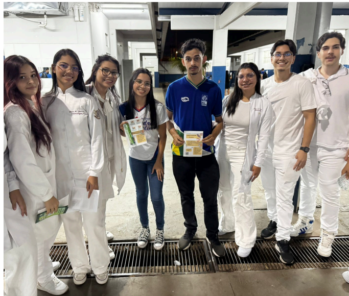
Figura 3 e 4. Passando orientações sobre saúde bucal.