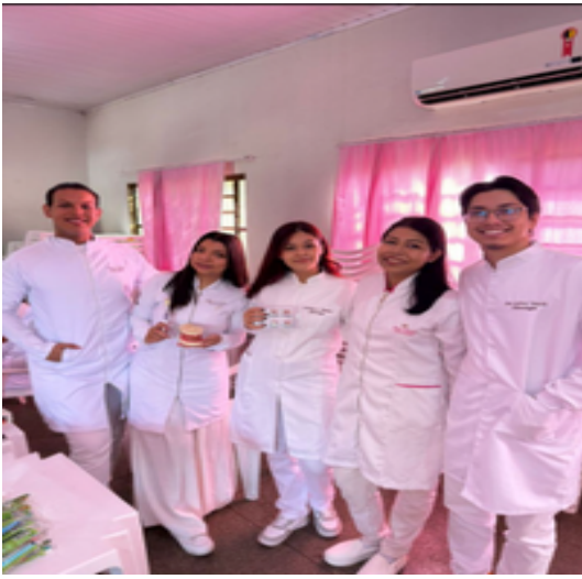
Figura 3. Grupo reunido.