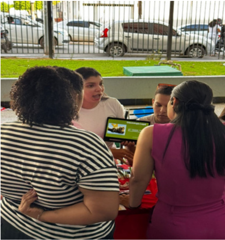
Figura 3. Mesa com os instrumentos.