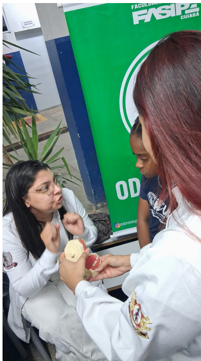
Figura 5. Grupo com a apresentação.