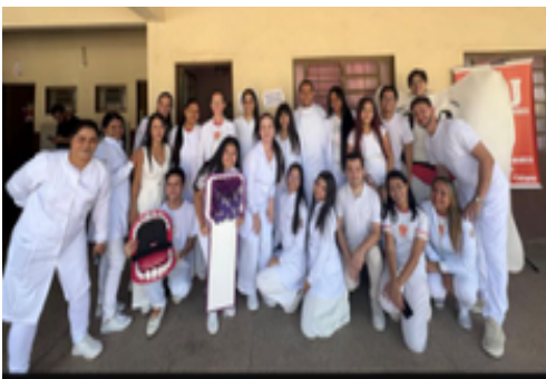
Figura 5. Foto de toda a turma presente no dia da ação