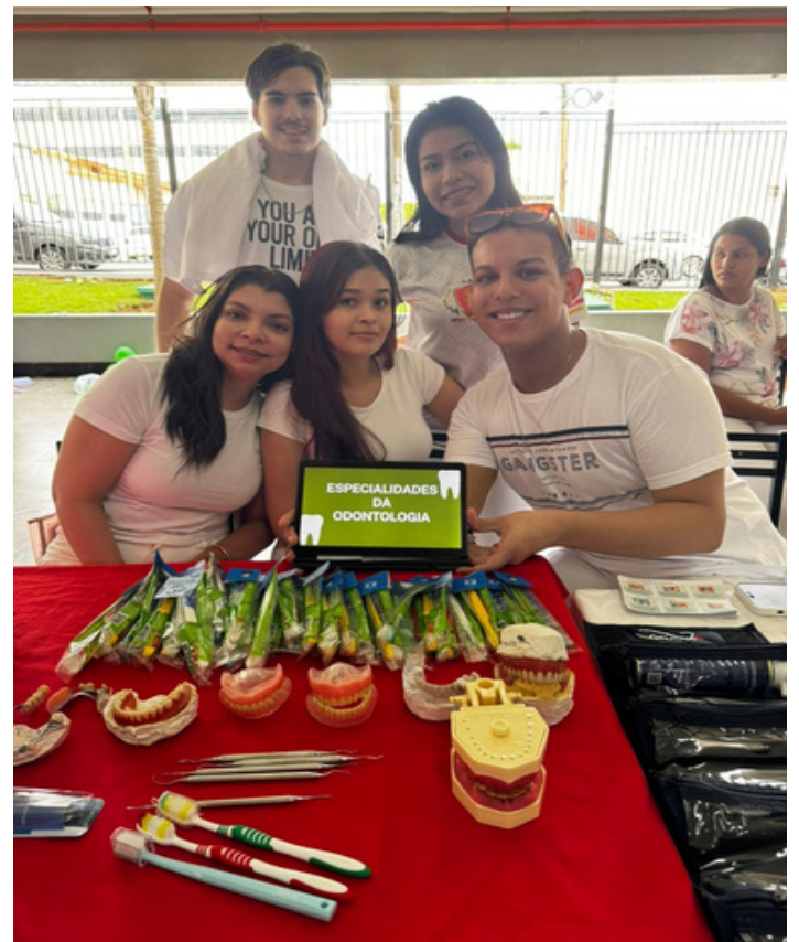
Figura 4. Grupo com a apresentação.